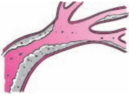
Slagaderverkalking Vetachtige stoffen hopen zich op in de vaatwand

Doordat de plaque naar binnen aangroeit, neemt deze steeds meer plaats in en vernauwt dus de slagader. Er kan dan minder bloed doorheen.