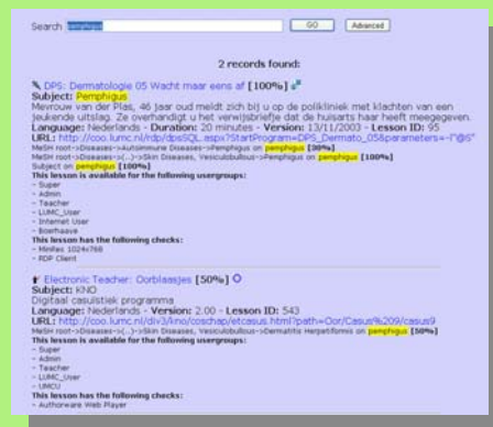
Figuur 3: Resultaat van een zoekopdracht door een COO ontwikkelaar, waarin o.a. wordt getoond: - de administratieve metadata van het COO - de classificatie - de gebruikersgroepen waarvoor de les beschikbaar is - de systeemeisen die het COO aan de computer stelt

Wilt u gebruik maken van de projectresultaten, maak dan een account aan in het Les Registratie Systeem (LRS.Net) : http://coo.lumc.nl