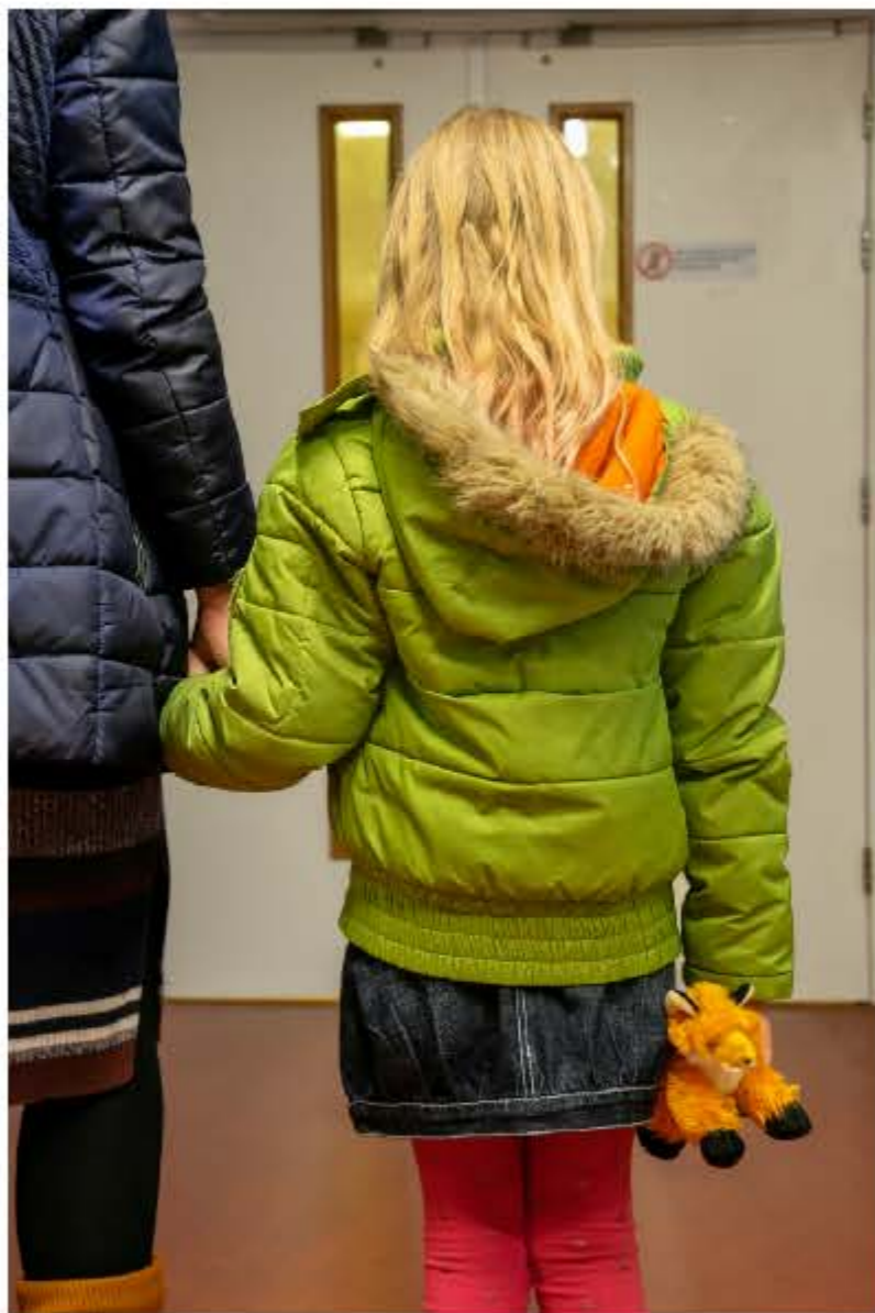
Dit is de ingang van de Volwassen Intensive Care. Hier liggen mensen die heel ziek zijn.