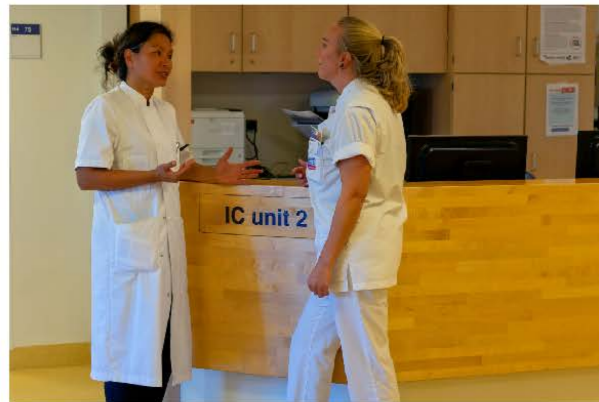
Bij ons op de afdeling werken verpleegkundigen en artsen die voor de zieke mensen, de patiënten, zorgen.