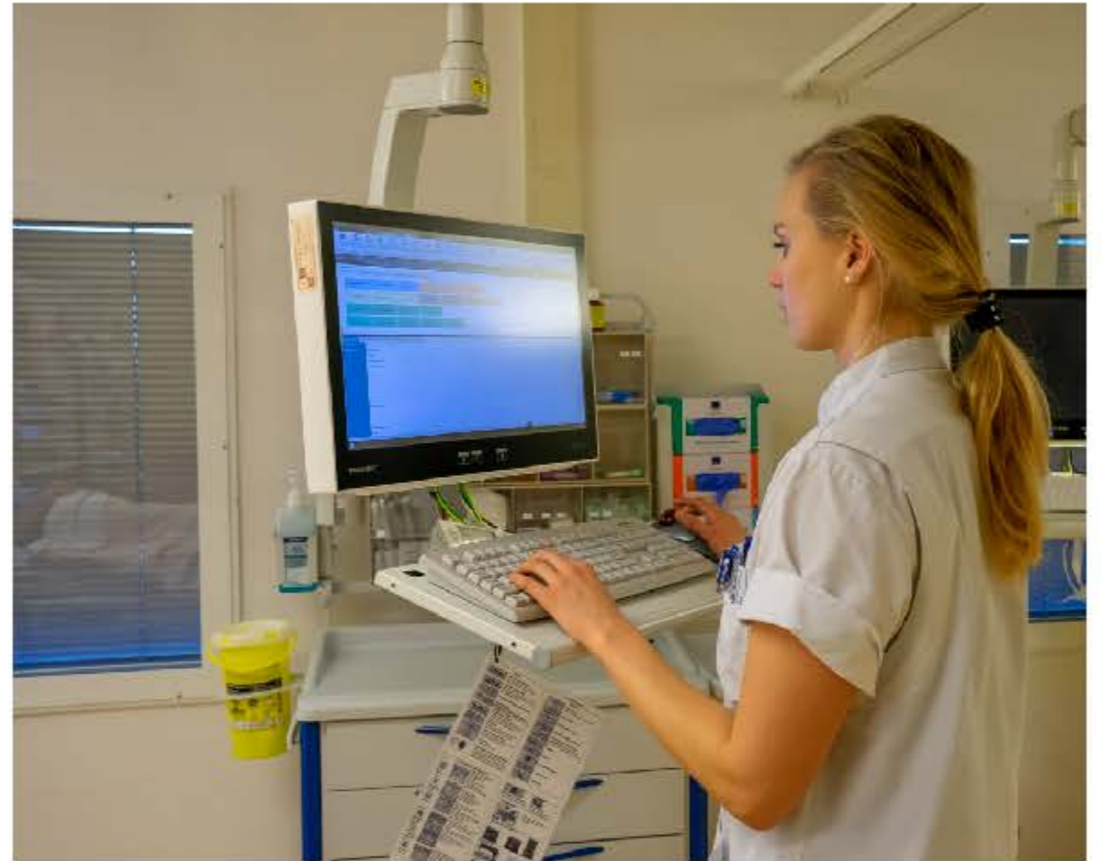
Bij het bed van de vader van Roos hangt een computer. In deze computer slaan de verpleegkundigen en artsen alle informatie op over haar vader.