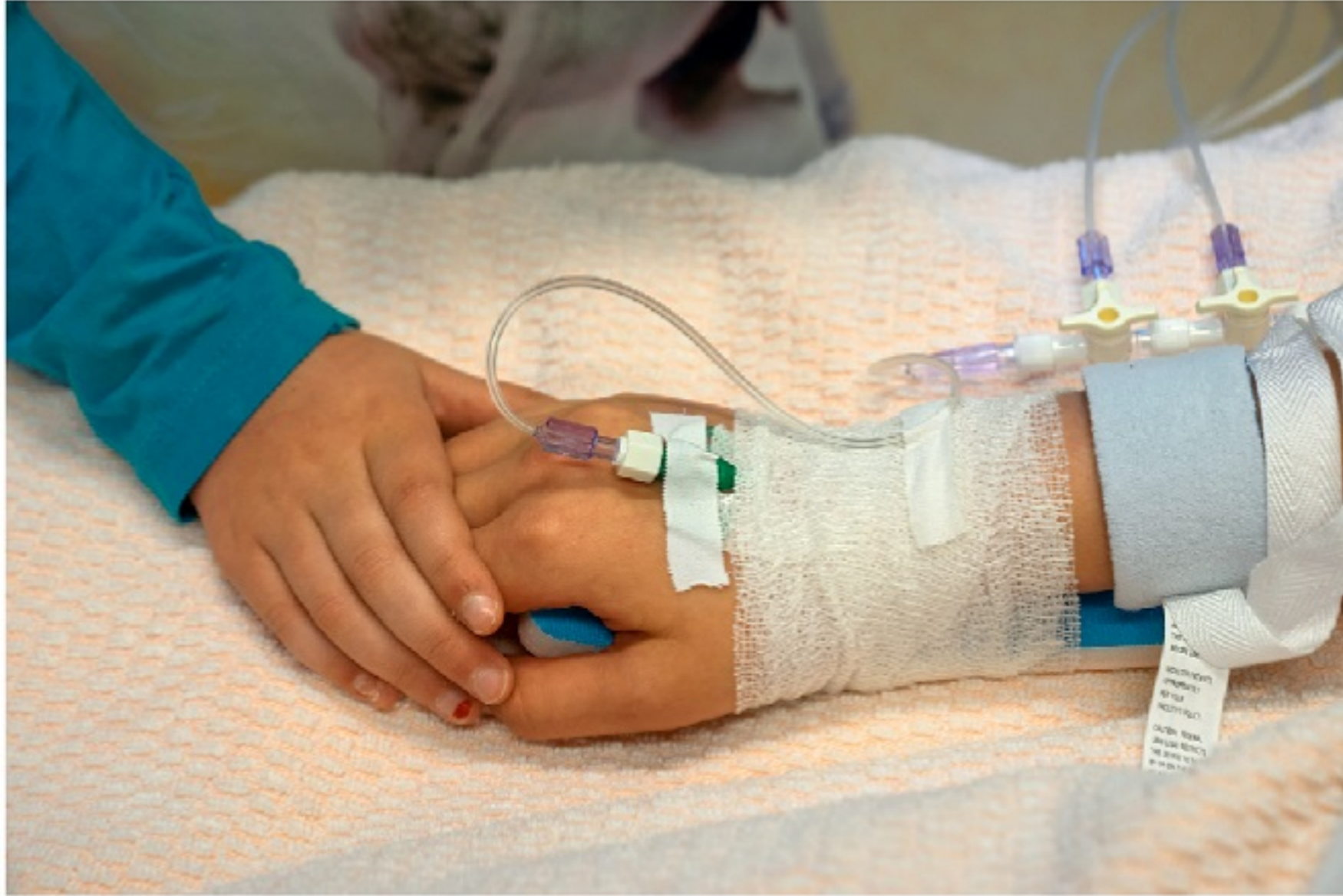
Roos haar zus heeft een plastic buisje in haar hand. Zo'n buisje noemen we een infuus. Door het infuus krijgt zij de medicijnen die zij nodig heeft. Dit gaat met behulp van pompen die naast het bed hangen.