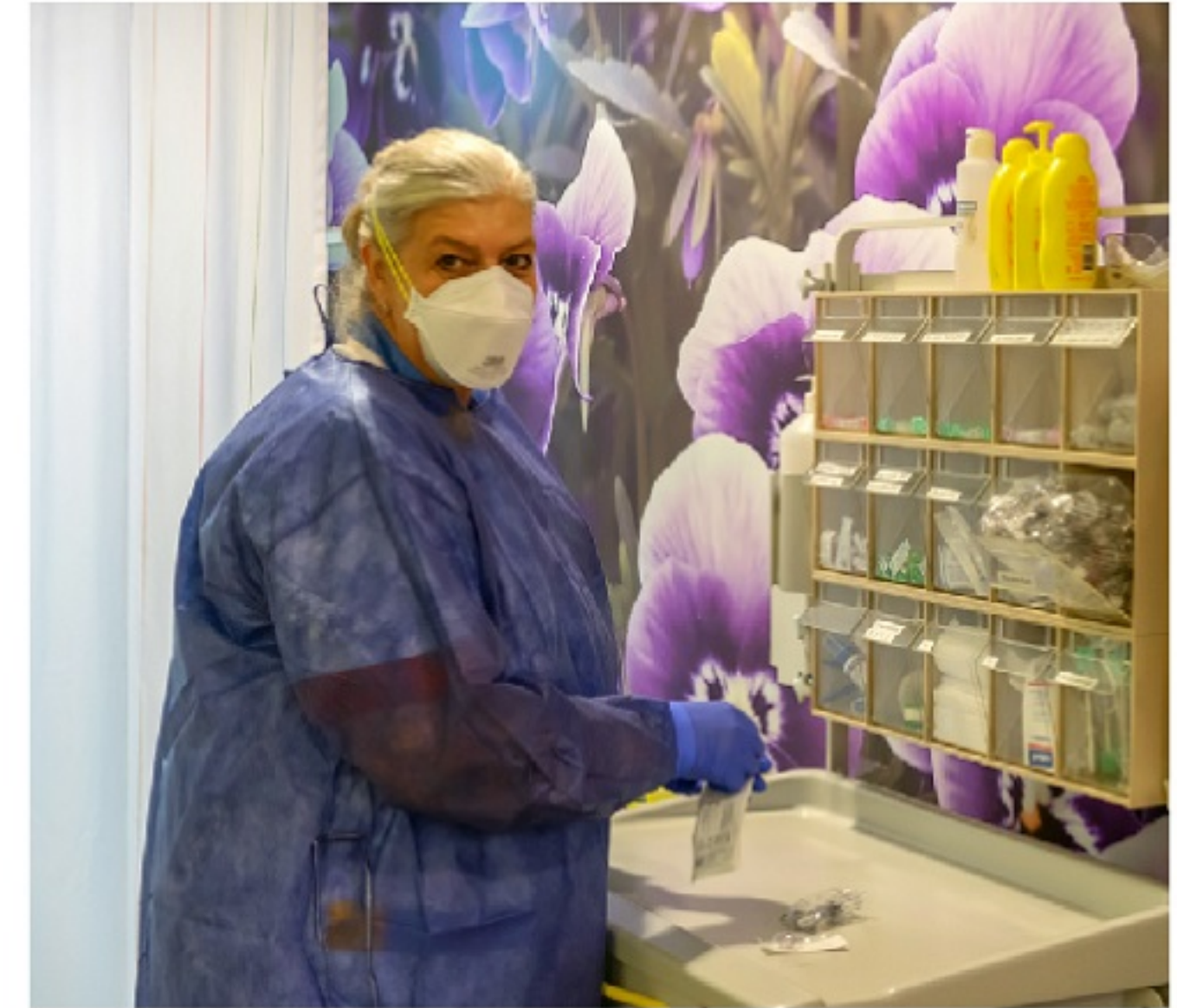
Soms dragen verpleegkundigen en artsen gekleurde schorten en handschoenen. Zij hebben daar regelmatig ook een masker bij op. Dit is om extra schoon te kunnen werken.