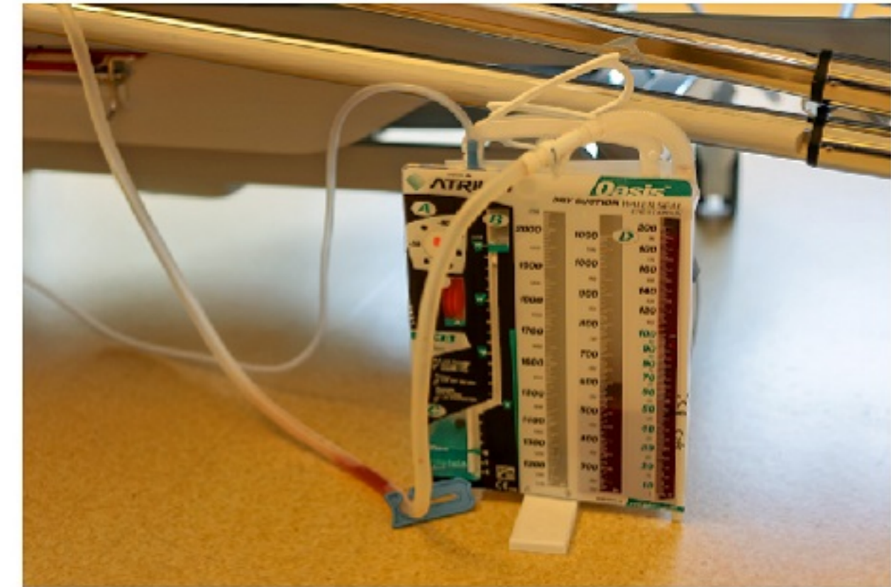
Naast sommige kinderen staat een bak op de grond of deze hangt aan het bed. Via een buis, dit noemen we een thoraxdrain, loopt er vocht en / of bloed in deze bak. Het is belangrijk dat deze bak niet omvalt.