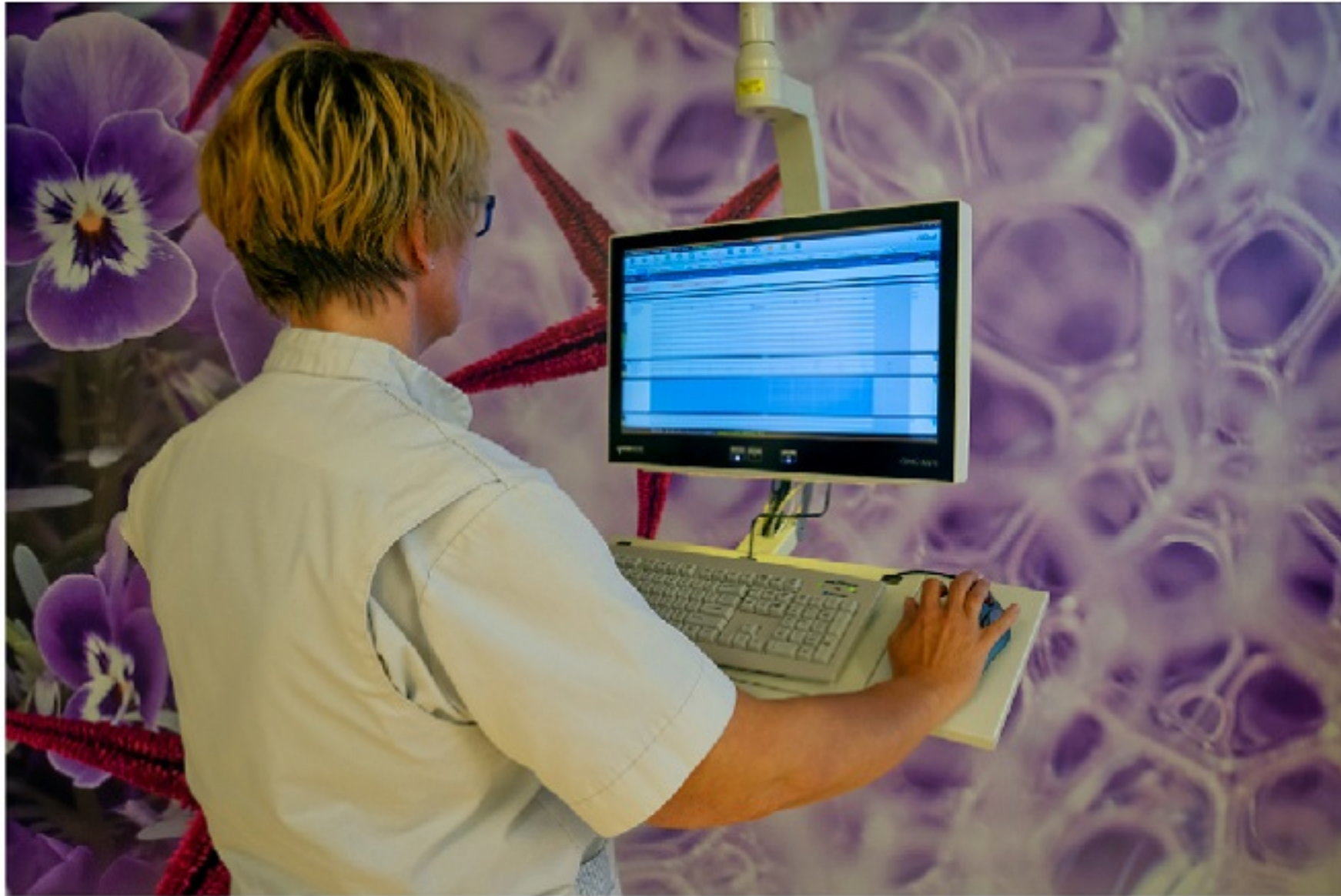
Bij het bed van de zus van Roos hangt een computer. In deze computer slaan de verpleegkundigen en artsen alle informatie op over haar zus.