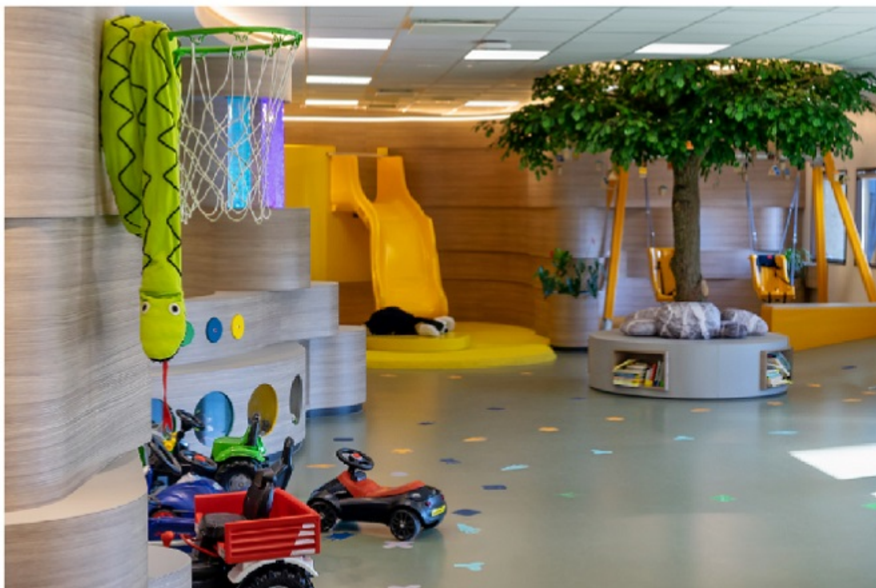
Nadat Roos op bezoek is geweest bij haar zus gaat ze nog even spelen in de Daktuin. Dit is een speelruimte op de 6e verdieping waar broertjes en zusjes kunnen spelen. Om hier te spelen moet je door een volwassene worden gebracht.