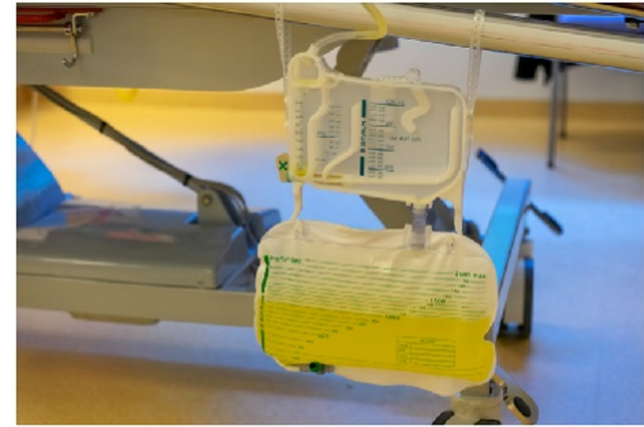
Plassen is moeilijk als je slaapt door medicijnen. De blaas wordt dan gelegegd door een buisje die vanuit de blaas naar een zak loopt. Deze zak met daarin plas kan je dan naast het bed zien hangen. De verpleegkundige leegt deze zak regelmatig.