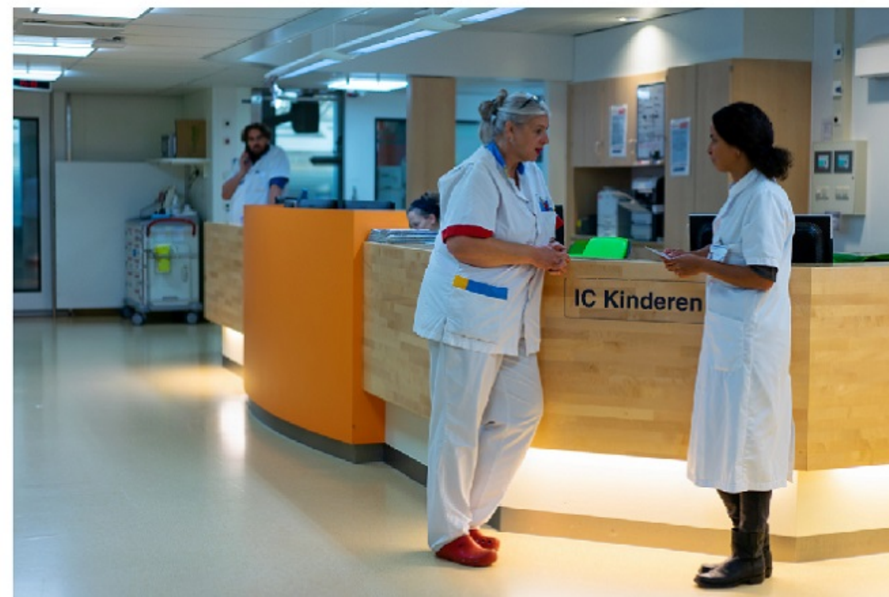
Bij ons op de afdeling werken verpleegkundigen en artsen die voor de kinderen zorgen.