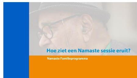
2. Hoe ziet een Namaste sessie eruit?