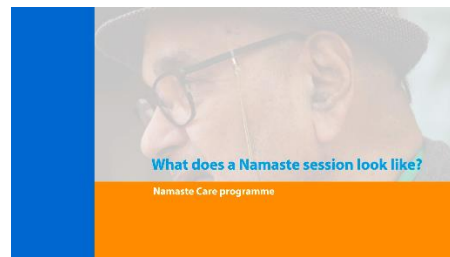
2. What does a Namaste session look like?