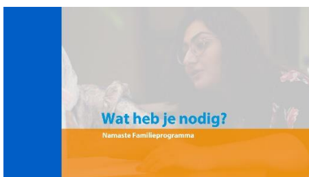
3. Wat heb je nodig?