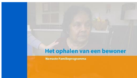
1. Het ophalen van een bewoner