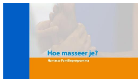
4. Hoe masseer je?