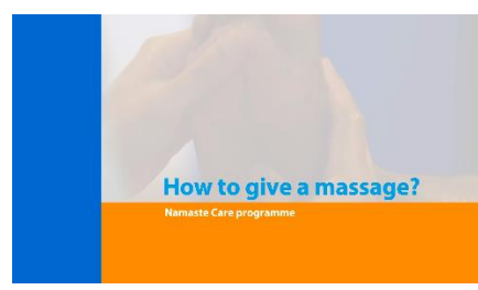
4. How to give a message